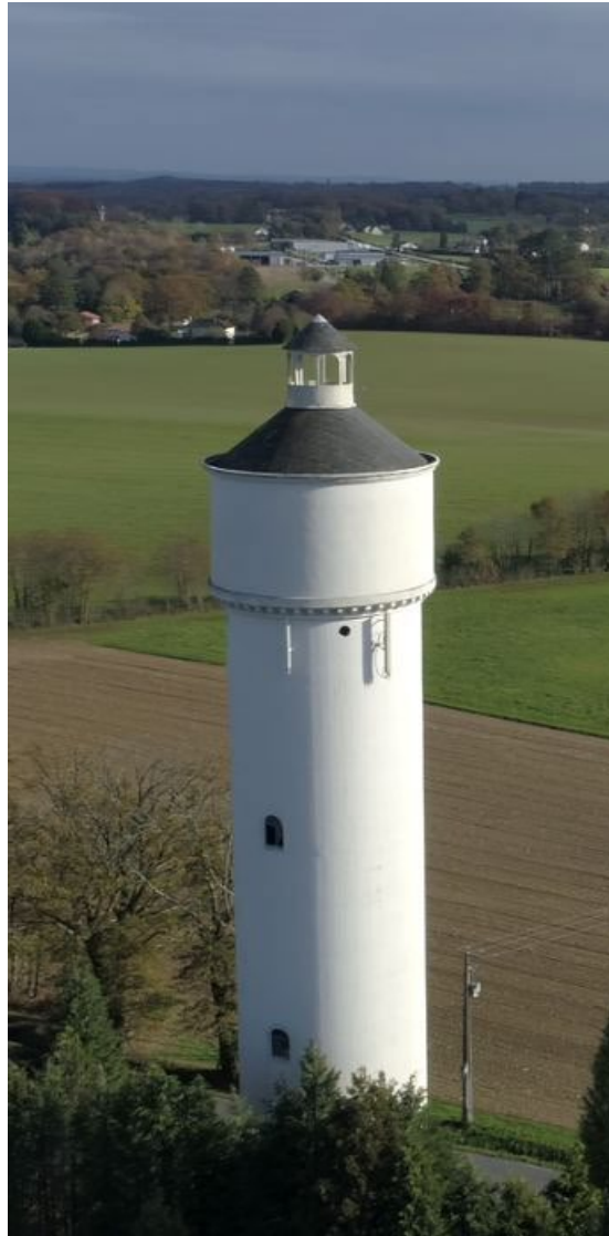
Vue du Ciel Réservoir de Lou Dougnou - Commune de PANAZOL