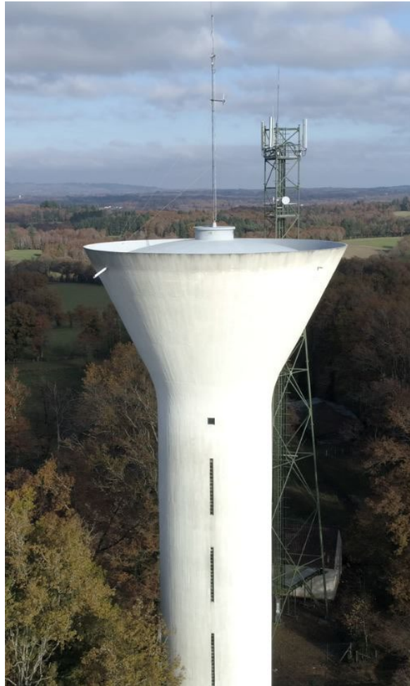
Vue du Ciel du Réservoir de La BARRE - Commune de VEYRAC