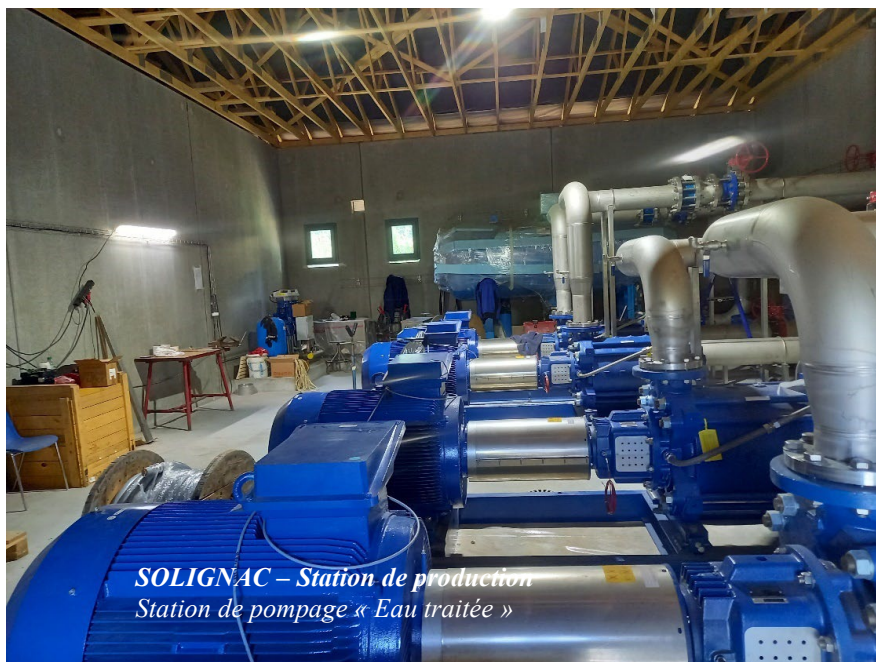
SOLIGNAC – Station de production Station de pompage « Eau traitée »