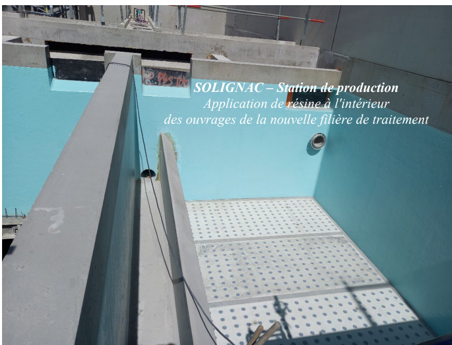
SOLIGNAC – Station de production Application de résine à l'intérieur des ouvrages de la nouvelle filière de traitement